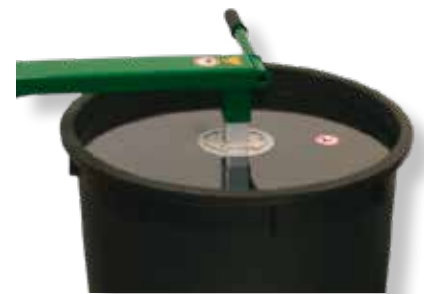
Optional mit Staubabdeckung