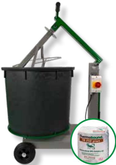
Bis zu 30 Mischungen/Stunde

TB MIX 100 ermöglicht ein zügiges Einbringen einer Ausgleichsschicht. Innerhalb einer Minute können bis zu 100 Liter Leichtbeton angerührt werden.