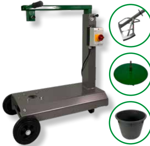
Ohne Werkzeug leicht zerlegbar