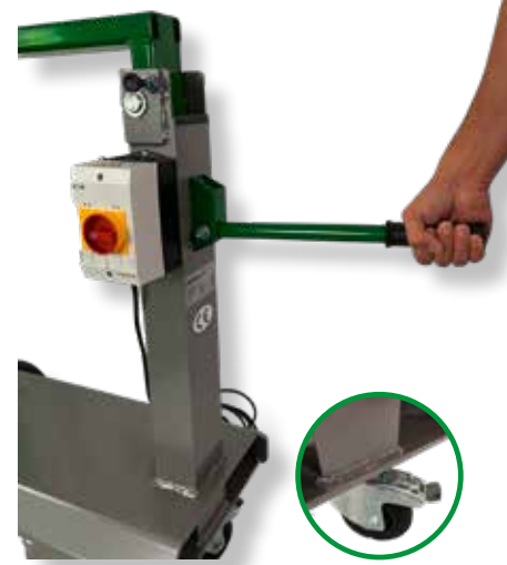
Einfach zu transportieren